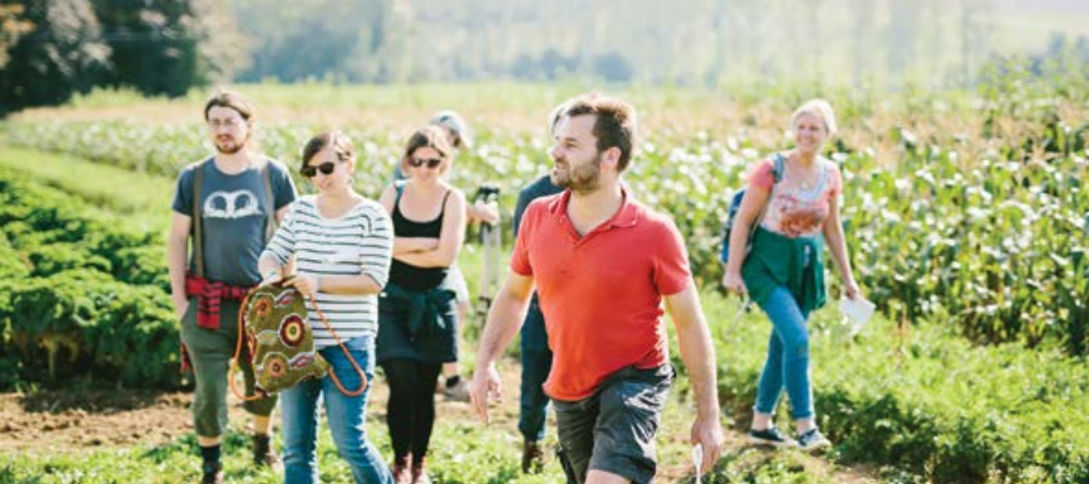
Evaluación de pares realizado por la iniciativa CSA GASAP, Bélgica @GASAP