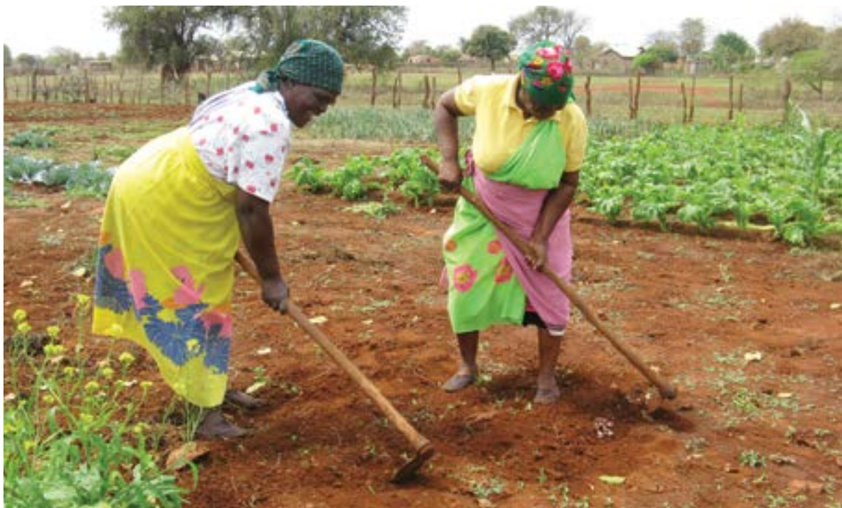
Integrantes mujeres del SPG Giyani labrando su tierra, Sudáfrica

Los mapas y los detalles de la finca se introducen en la base de datos del SPG sostenida por la iniciativa de SPG. También pueden publicarse en línea en un sitio web para promover la transparencia, si así se decide.