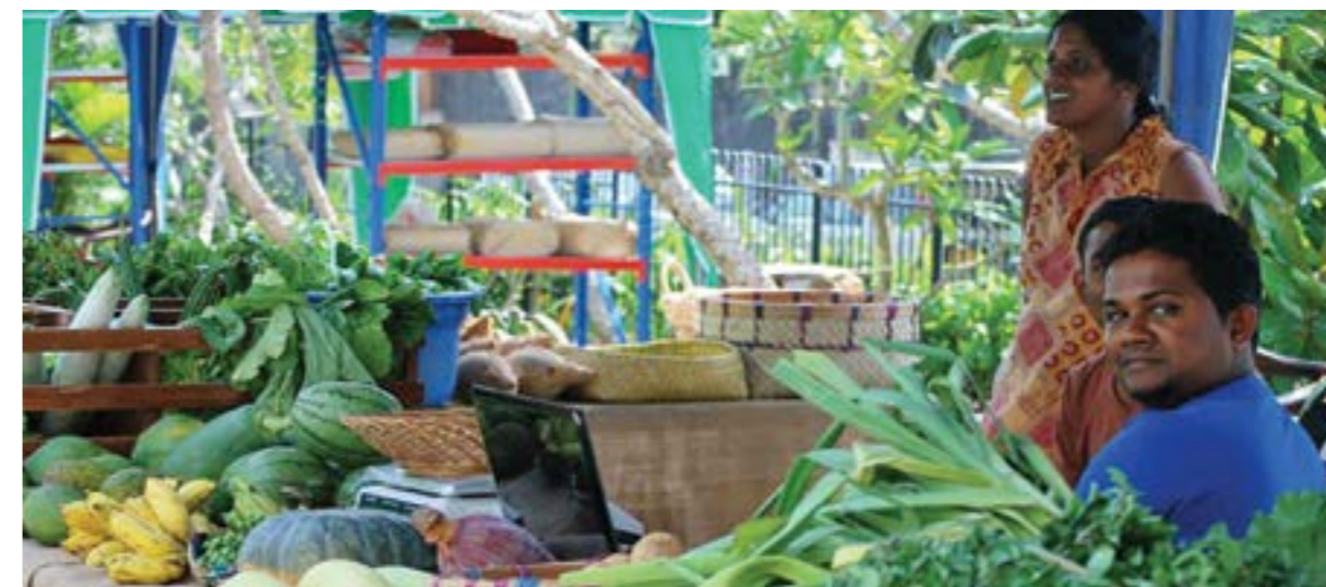
Agricultores certificados con SPG en el mercado sabatino de Good Market en Colombo, Sri Lanka

Es fundamental que una iniciativa de SPG incluya disposiciones para que sus miembros puedan apelar una decisión que la persona afectada perciba como injusta, por ejemplo, la suspensión de la certificación en casos de incumplimiento grave.