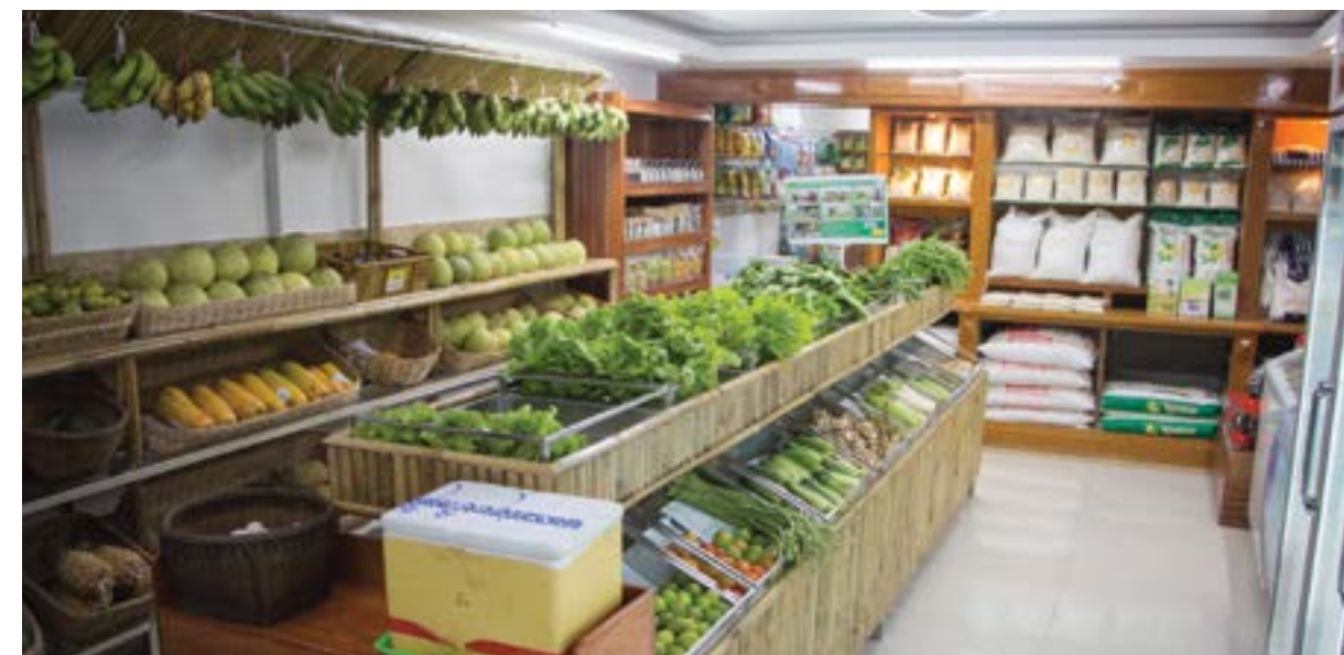
Tienda orgánica vendiendo productos certificados con SPG en Cambodia

El acceso confiable al mercado es un poderoso incentivo para motivar a otros agricultores a hacer la transición a la producción orgánica y a unirse a una iniciativa de SPG. Hay varios canales de mercado abiertos a los productos certificados por los SPG, entre ellos la venta directa a la entrada de la finca, la entrega a domicilio, los mercados locales, las tiendas de productos orgánicos, los supermercados y los mayoristas, las compras públicas, los restaurantes, los hoteles y los servicios de catering. Crear un plan de comercialización para involucrar y vincular activamente a los agricultores a pequeña escala con los mercados hace parte de la estrategia de desarrollo de los SPG.