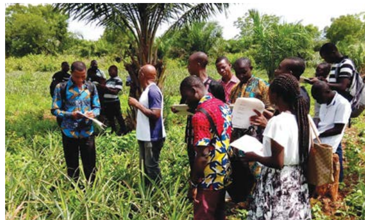
Visita de evaluación de pares con productores e iniciativas locales de producción de alimentos, Togo

No obstante, es posible que un productor certificado por un SPG desee proveer a un mercado de exportación. Por lo tanto, tendría que vincularse a una certificación de terceros. Este vínculo puede ocurrir a través de la certificación de terceros como individuo o a través de la certificación de grupo y un SIC. La transición de un SPG a una certificación de terceros como miembro de un grupo de productores podría ser más fácil que obtener una certificación individual de tercera parte. En algunos casos, las iniciativas de SPG y los operadores externos han podido acordar procedimientos que permiten una transición. Tales acuerdos pueden incluir el compartir documentos o en algunos casos, la realización de auditorías al SPG por parte de un certificador externo. En situaciones en las que una iniciativa de SPG recientemente conformada esté interesada en obtener la certificación de terceros en una etapa posterior, puede ser útil involucrar a un representante de un organismo de certificación en el diseño inicial del SPG. Esto puede ayudar a generar confianza y sentar una base sólida para futuras relaciones de trabajo. Que esto suceda o no, depende enteramente de los participantes del SPG. Es importante que los actores clave puedan mantenerse a cargo de los procesos y la toma de decisiones.