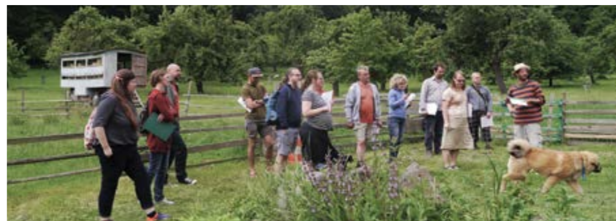
Visita de evaluación de pares con consumidores e iniciativas locales de producción de alimentos, República Checa