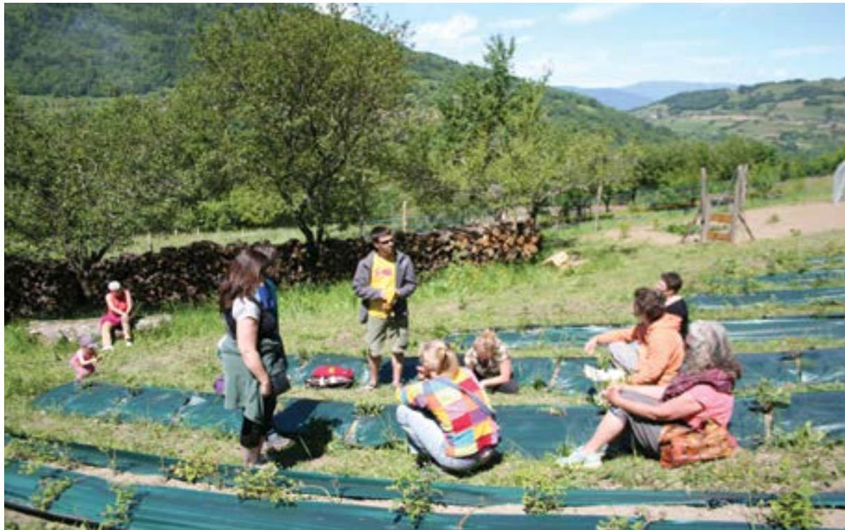
Visita de SPG a una finca en AMAP, organizado por la Red AMAP en Auvergne Rhone-Alpes, 2014

de participación son bajos y requiere principalmente trabajo voluntario en lugar de gastos financieros. Además, la documentación se reduce, lo que hace que un SPG sea más accesible para los pequeños operadores.