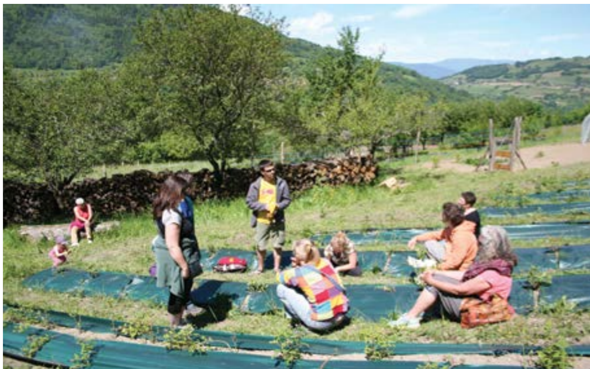
Visita de SPG a una finca en AMAP, organizado por la Red AMAP en Auvergne Rhone-Alpes, 2014

de participación son bajos y requiere principalmente trabajo voluntario en lugar de gastos financieros. Además, la documentación se reduce, lo que hace que un SPG sea más accesible para los pequeños operadores.