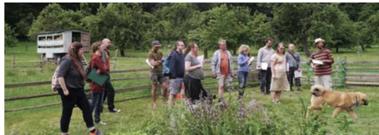
Visita de evaluación de pares con consumidores e iniciativas locales de producción de alimentos, República Checa