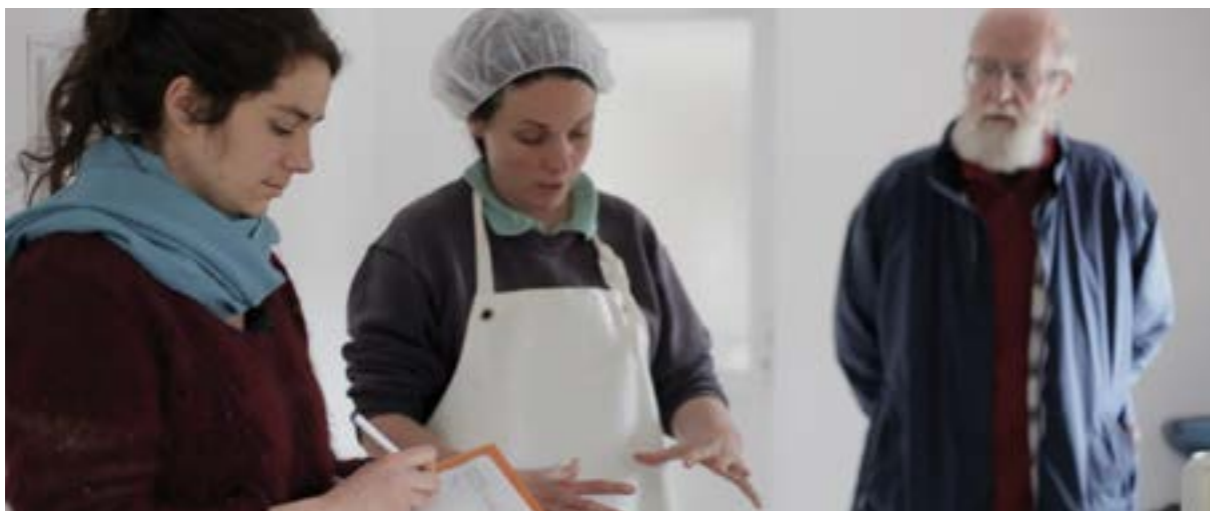
Evaluación de pares a un productor de queso de cabra realizado por la iniciativa SPG Nature et Progrès, Francia

Decidir sobre el número y la composición de un equipo de revisión de pares es muy importante. También es fundamental definir el rol que desempeñará cada miembro del equipo durante la visita a una finca. Las iniciativas de SPG establecen diferentes tipos y números de personas a dichos equipos. Es importante que todos los representantes de los actores clave tengan la oportunidad de unirse a estos equipos y que todos los participantes estén familiarizados con sus roles y funciones. La Red Ecovida (Brasil) requiere que al menos tres personas en el SPG participen en el proceso de revisión. La OFNZ (Nueva Zelanda) exige que todos los miembros del grupo local estén presentes en la evaluación de los demás. Esto equivale entre cuatro a ocho productores, dependiendo del tamaño del grupo local. Para sus visitas anuales, Nature & Progrès (Francia) cuenta con un equipo compuesto por un productor y un consumidor, éstos cambian por cada productor visitado. Estas personas son miembros del SPG y son designadas por el comité local de certificación, que planifica las rotaciones del equipo para evitar conflictos de interés y una revisión recíproca entre productores.