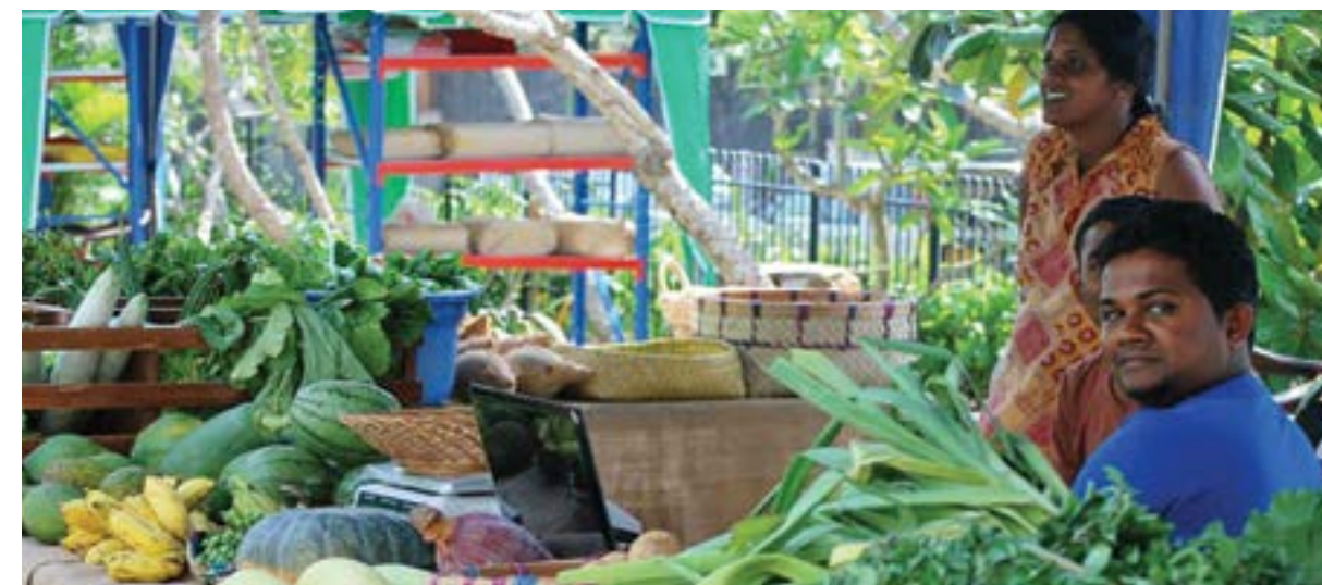
Agricultores certificados con SPG en el mercado sabatino de Good Market en Colombo, Sri Lanka

Es fundamental que una iniciativa de SPG incluya disposiciones para que sus miembros puedan apelar una decisión que la persona afectada perciba como injusta, por ejemplo, la suspensión de la certificación en casos de incumplimiento grave.