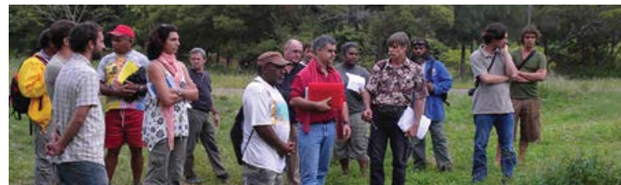
Evaluación de pares de la iniciativa SPG Biocaledonia, Fiji

Por ejemplo, el modelo estadounidense de Certified Natural Grown (CNG) ha tomado medidas adicionales para apadrinar a los agricultores novatos con agricultores experimentados de sus redes para sus primeras evaluaciones. Alternativamente, los formularios de inspección de CNG han sido actualizados para incluir y fomentar el debate en torno a las técnicas de producción más avanzadas, las que podrían tener mayores beneficios ecológicos o financieros que las prácticas actuales de un productor. También CNG está desarrollando videos de capacitación que estarán disponibles en línea y a pedido, para abordar los desafíos y las mejores prácticas para el manejo de malezas, plagas y enfermedades de acuerdo con las normas de CNG. Estos videos se complementarán con videoconferencias en vivo en las que los participantes pueden hacer preguntas a un agricultor experimentado.