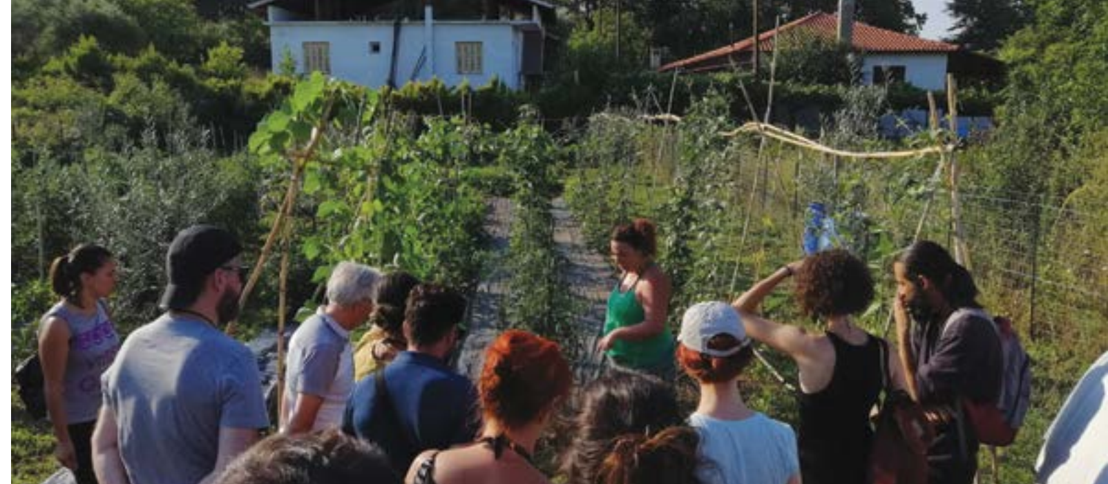
Visita de evaluación de pares con consumidores e iniciativas locales de producción de alimentos, Grecia @Agroecopolis